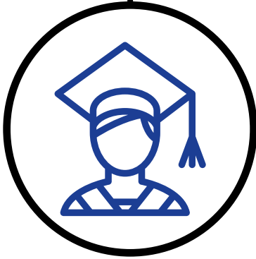
تعليم عالي مجاني في الجامعات الحكومية & في جامعات الاتحاد الأوروبي رسوم منخفضة جدا