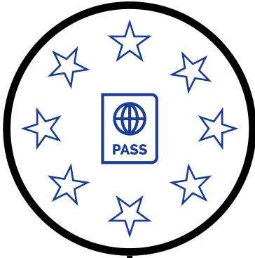
جواز السفر الأوروبي